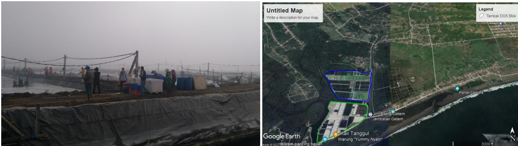
Gambar 1. Lokasi tambak PT Delta Guna Sukses

PT Mega Marine Pride (PT MMP) merupakan salah satu perusahaan processing udang yang ada di wilayah Jawa Timur. Perusahaan ini mendaftarkan PT Delta Guna Sukses (PT DGS) sebagai supply chain mereka. PT. Delta Guna Sukses (PT. DGS) merupakan salah satu perusahaan yang melakukan kegiatan budidaya udang dari jenis Penaeus vannamei atau lebih dikenal dengan sebutan udang Vaname. PT DGS beradai di wilayah selatan Kabupaten Jember, tepatnya di Desa Mayangan, Kecamatan Gumukmas. Perusahaan ini telah melakukan kegiatan operasional budidaya-nya dari tahun 1987 berproduksi pertama kali tahun 1988 (Blok A), awalnya dengan membudidayakan udang windu ( Penaeus monodon ) secara semi-intensive. Sejak tahun 2000, secara bertahap, PT. DGS membudidayakan udang jenis Liptopenaeus vannamei dengan menggunakan teknologi intensif intensif dan tingkat kepadatan tebar antara 125 – 180 ekor/m 3 . Benih yang digunakan adalah dari hatchery yang berasal dari sekitar Jawa Timur dan juga wilayah lain di Indonesia. Produksi yang dihasilkan sekitar 350 ton/tahun.