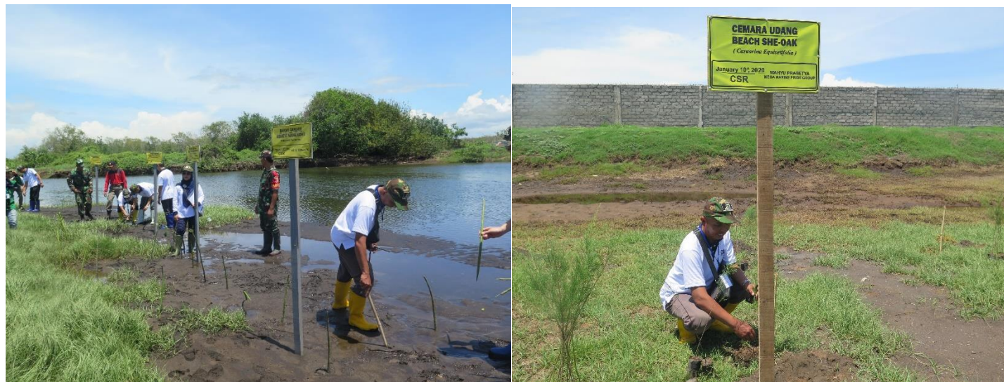
Gambar 3. Kegiatan penanaman di PT DGS

PT Mega Marine Pride dengan supply chain nya yaitu PT Delta Guna Sukses merupakan perusahaan yang sangat konsisten dalam menjalankan kegiatan AIP berbasis ASC. Hal ini dibuktikan dengan mereka mampu mempertahankan status sertifikat ASC sampai pada proses surveillan ke 3 atau resertifikasi. Kegiatan surveillan ke 3 telah dilaksanakan pada Desember 2021. Perjalanan panjang mereka telah dimulai dari tahun 2017 ketika mereka bergabung menjadi anggota seafood saves dan dilanjutkan dengan proses Aquaculture Improvement Program sebagai proses untuk menuju sertifikasi ASC. Kajian BEIA pSIA sebagai salah satu komponen penting dalam AIP ASC telah dilakukan pada April 2018 dan untuk pSIA telah dilakukan proses penilaian kembali pada Oktober 2021. Saah satu rekomendasi dari hasil kegiatan kajian BEIA pSIA adalah pelaksanan rehabilitasi ekosistem di sekitar lokasi tambak PT DGS, dan hal tersebut telah dilaksanakan dengan melakukan penanaman beberapa jenis tanaman seperti mangrove, jaranan dan cemara.